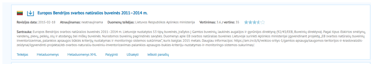
1 pav. Europos Bendrijos svarbos natūralių buveinių (2011–2014 m. inventorizacija)